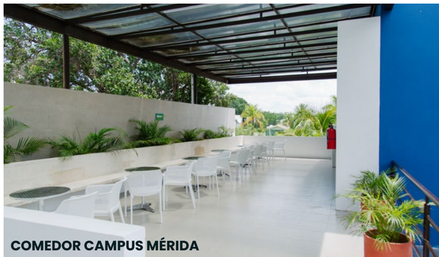
COMEDOR CAMPUS MÉRIDA

RVOE: ACUERDO 345 (23 DE FEBRERO 2024) Y EL REGISTRO NACIONAL DE PROFESIONES A NIVEL FEDERAL